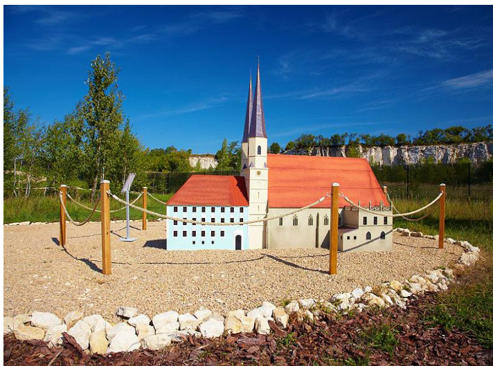
Sanktuarium Maryjne Matki Bożej Królowej Bawarii w Altötting