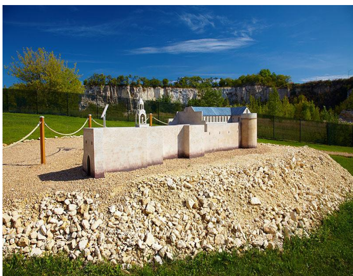
Bazylika Narodzenia Pańskiego w Betlejem