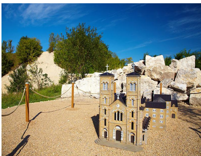
Bazylika Naszej Pani z La Salette