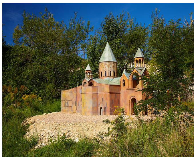
Katedra w Eczmiadynie