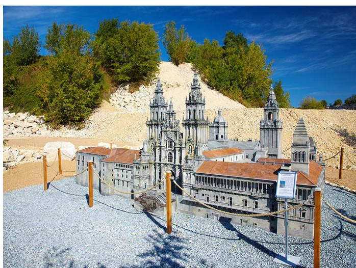
Katedra Św. Jakuba w Santiago De Compostella