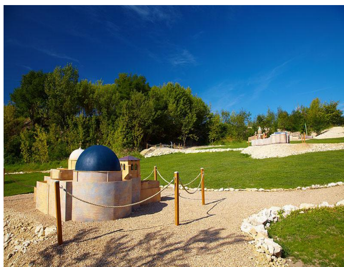
Bazylika Grobu Pańskiego