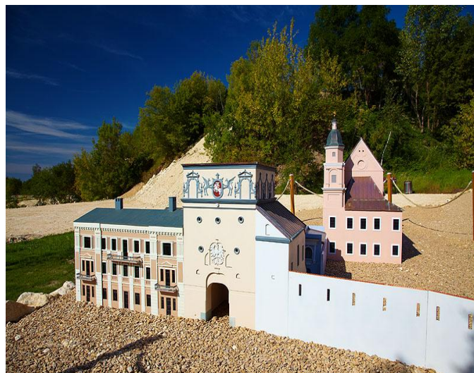
Ostra Brama w Wilnie