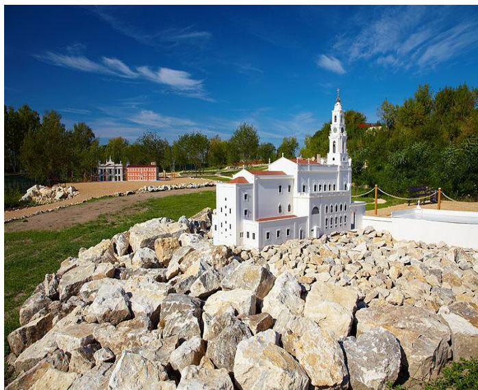
Bazylika Matki Bożej Różańcowej w Fatimie