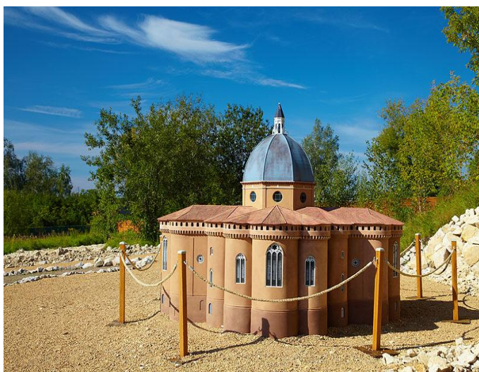
Bazylika Świętego Domu w Loreto