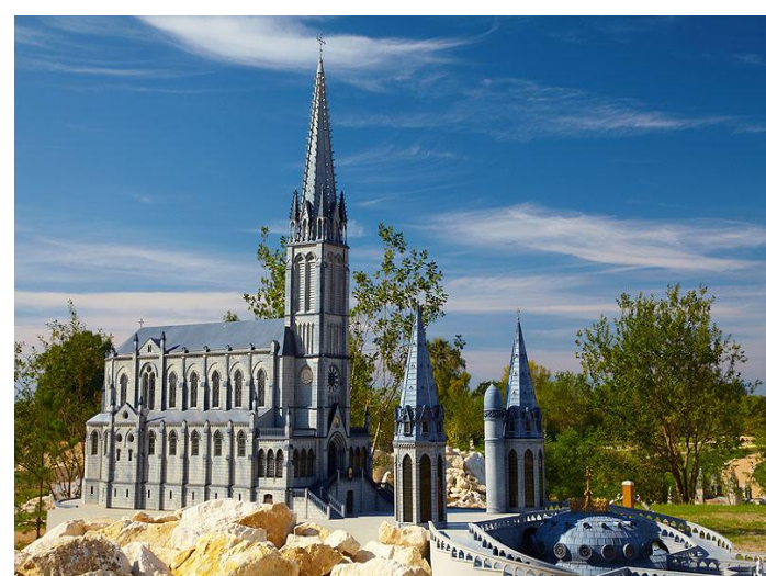
Bazylika Niepokalanego Poczęcia w Lourdes