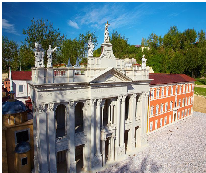
Bazylika Św. Jana na Lateranie